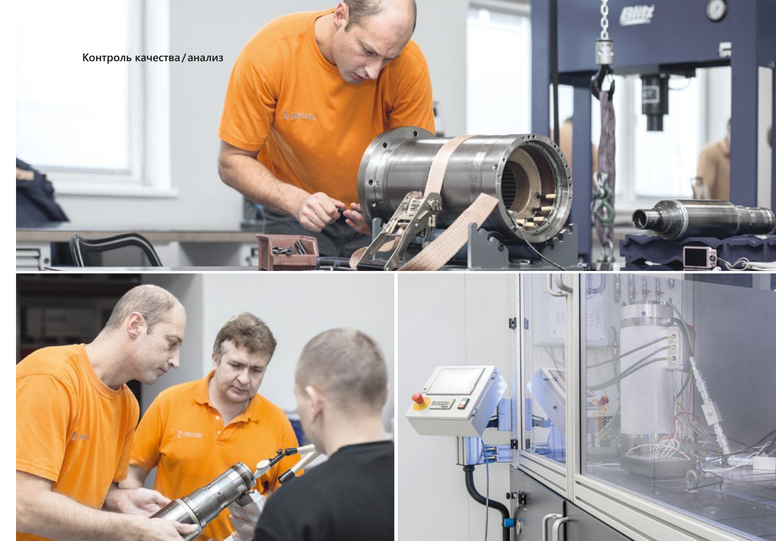
Контроль качества / анализ